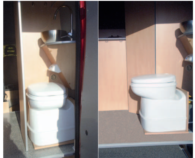
■ Eingeschoben macht sich die Toilette im Heck ganz klein. Ausgezogen bietet sie ausreichend Bewegungsfreiheit.

wand zuzuklappen und das Heck damit anders zu nutzen. Dazu kommen Schränke im Überfluss, eine bequeme Sitzbank, die sich zum Einzelbett umbauen lässt, mit einer Verbreiterung auch als Doppel liege nutzbar, und ein Doppelbett mit erstaunlichem