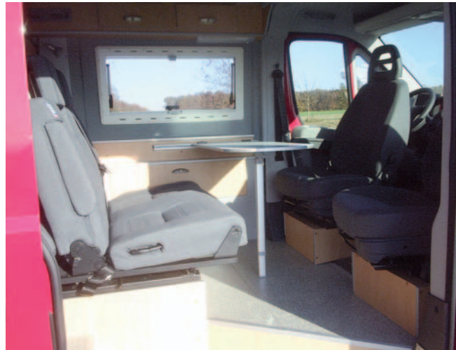
■ Der Vorderwagen des Family 2+2 wird eingenommen von der bequemen Zweierbank und den drehbaren Fahrerhaussitzen.