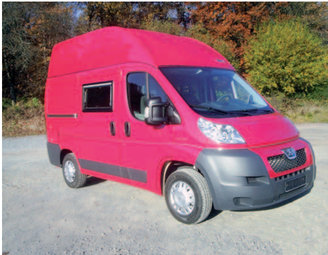
■ Aus dem kurzen Peugeot Boxer baut Behl ein komplettes Reisemobil mit SCA-Hochdach und viel Stauraum.