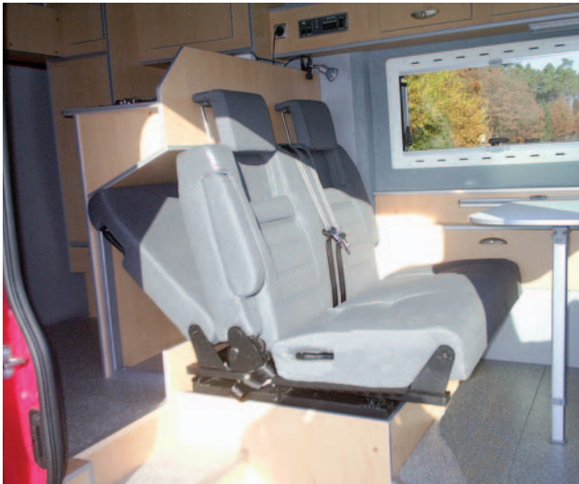
■ Geschlafen wird einmal im Hochdachbett, zum andern auf der umgelegten Sitzbank mit den Füßen unter der Küche.

im Heck noch drin. Dazu wird mal eben die bewährte, drehbare Thetford Cassettentoilette C200 auf einen Auszugsschlitten montiert, der es ermöglicht, die Toilette bei Nichtgebrauch unter das Handwaschbecken aus Edelstahl zu schieben, die Trenn-