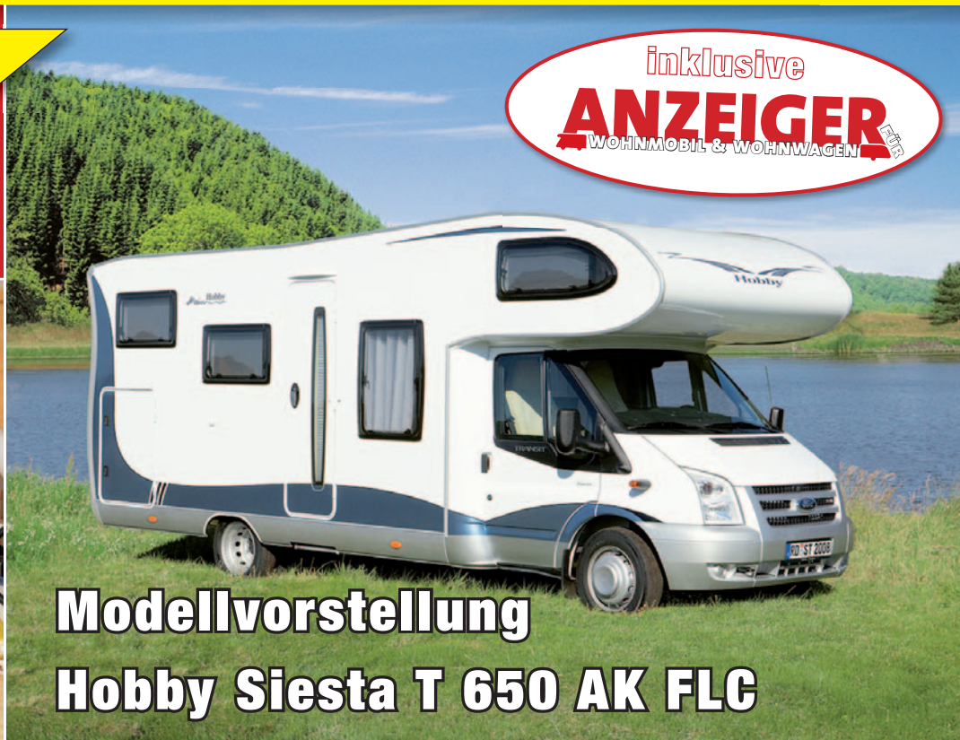
Modellvorstellung Hobby Siesta T 650 AK FLC

inklusive ANZEIGER WOHNMOBIL & WOHNWAGEN